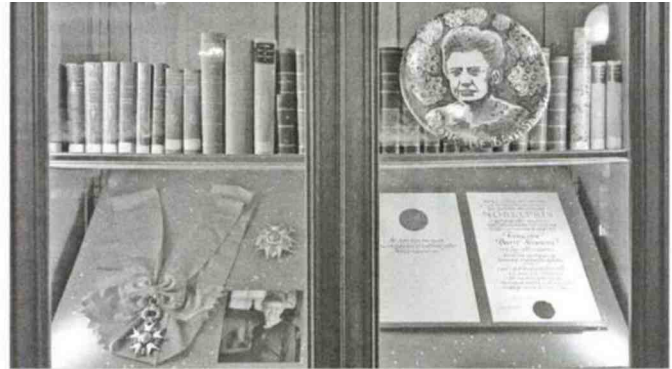
Vitrine dédiée à Françoise Barré-Sinoussi, Prix Nobel de Physiologie-Médecine en 2008 pour la découverte du VIH au sein de l'unité du Pr Luc Montagnier

- A propos des scientifiques, des travaux et des découvertes emblématiques de l'Institut depuis sa création il y a 130 ans : les pasteuriens illustres ou remarquables, les